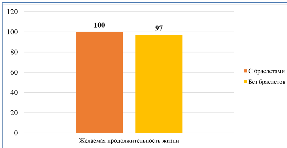
Рисунок 4.1 – Медианное значение желаемой продолжительности жизни подопечных организаций, имеющих и не имеющих браслет с тревожной кнопкой, лет

Способствовать повышению самооценки состояния здоровья среди благополучателей могут проводимые клиникой-партнером мероприятия по лечебной физкультуре. За 1,5 месяца (март-апрель 2024 г.) проведено 6 занятий, в которых приняло участие 24% подопечных с браслетами.